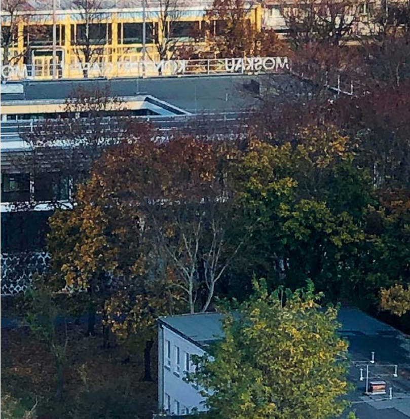
Grundstücksfläche Schillingstraße 12