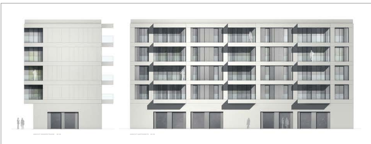
Modell Hausansicht 1

Wir werden Sie über die weiteren Entwicklungen auf dem Laufenden halten. ●